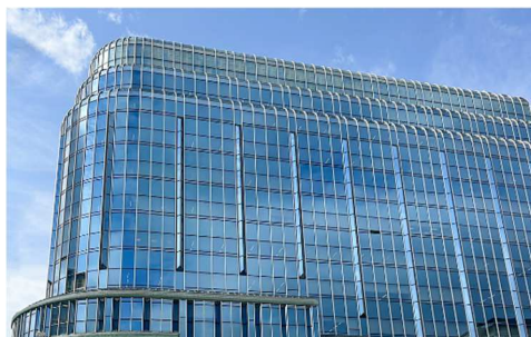
(金沢オフィス 外観)