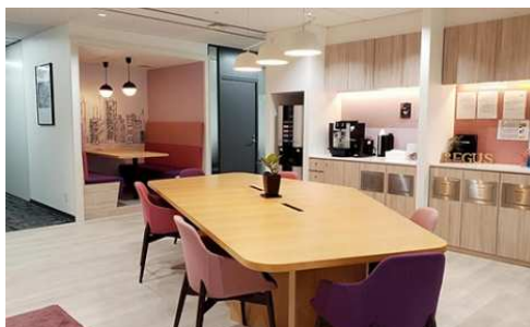
(金沢オフィス 内観)

今後とも、北陸エリアの皆様との更なる連携を深め、地域の方々との協力関係を深めながら、地 域社会への貢献を積極的に行ってまいります。何卒、よろしくお願い申し上げます。