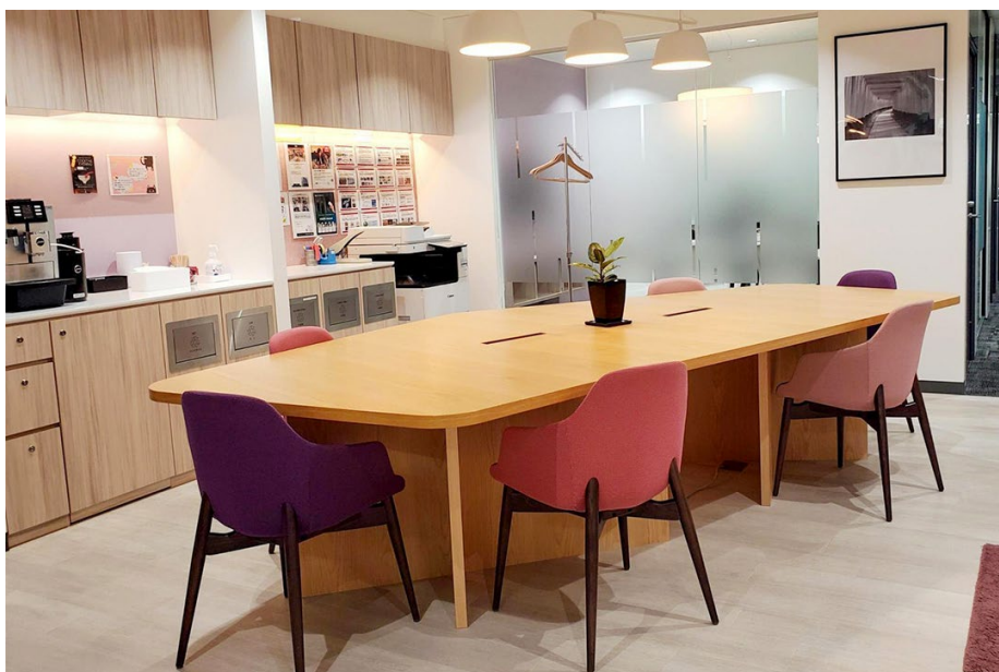
▲金沢オフィス内観写真